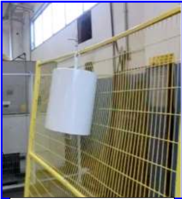
Durante il CRASH