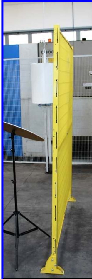
Dopo il CRASH